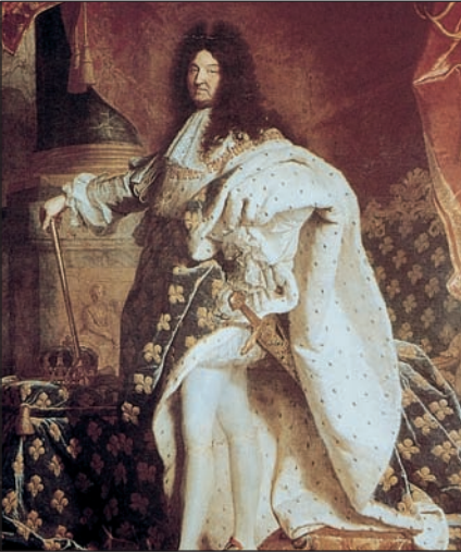
Luis XIV de Francia, conocido como el Rey Sol, fue el máximo exponente del absolutismo de origen divino.

En los inicios de la Edad Moderna, los reyes autoritarios europeos habían acumulado un gran poder, pero tenían que respetar las decisiones de las instituciones políticas y los particularismos de sus territorios. A lo largo del siglo XVII, estos monarcas acabaron concentrando todo el poder. Sólo en Inglaterra el rey estaba sometido al Parlamento.