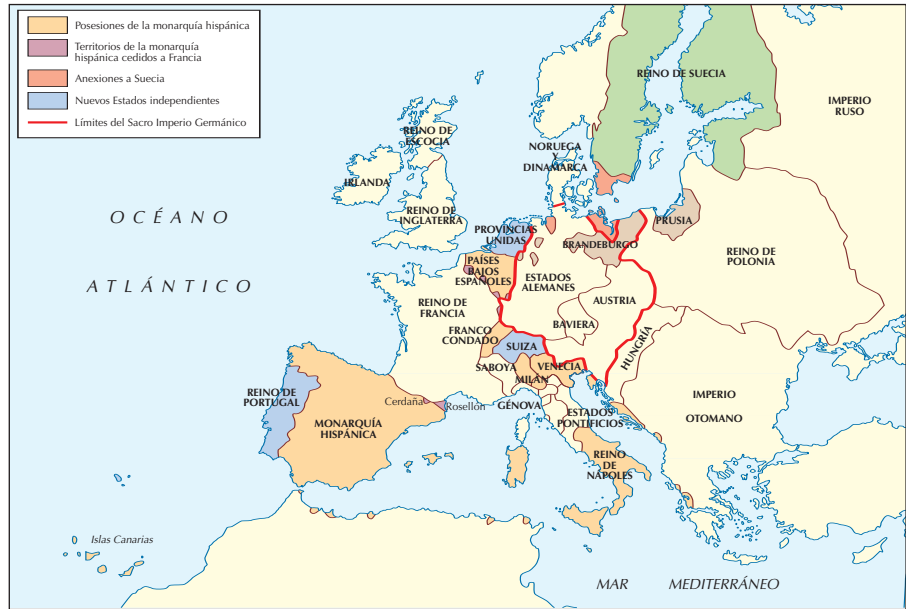
Europa después del Tratado de los Pirineos.

A ellos se enfrentaron los príncipes protestantes alemanes, quienes querían conservar la autonomía de sus Estados dentro del imperio, con la ayuda de Dinamarca y Suecia , también protestantes. Pero sobre todo les apoyó Francia , que, a pesar de ser un Estado católico, quería evitar que la casa de los Habsburgo alcanzara la hegemonía europea.