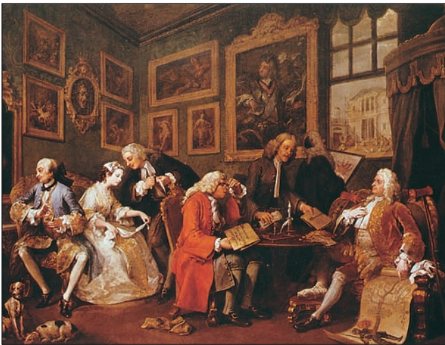
Hogarth. El contrato matrimonial. Algunos burgueses ricos se emparentaban con miembros de la nobleza para obtener una posición social más elevada. Por su parte, los nobles arruinados mejoraban así su situación económica.

El mercantilismo es la política económica que aplicaron las monarquías europeas entre la segunda mitad del siglo XVII y el XVIII. Partía de la idea de que sólo una nación rica podía ser poderosa y la riqueza de un país dependía de la cantidad de oro y plata acumulados . Estos metales se conseguían con la