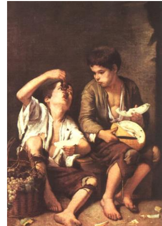
Niños comiendo uvas y melón (Murillo)