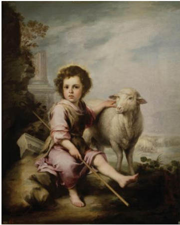
El buen pastor (Murillo)