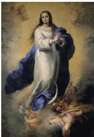
Inmaculada Concepción de El Escorial (Murillo)