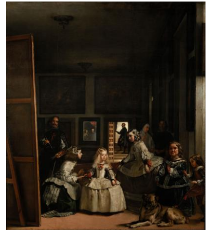
Las meninas (Velázquez)