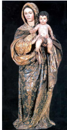
La Virgen de la Oliva (Alonso Cano)