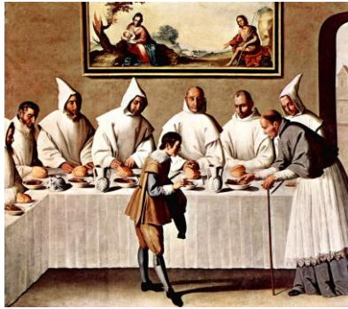
San Hugo en el refectorio de los cartujos (Zurbarán)