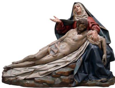
La Piedad (Gregorio Fernández)