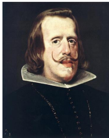
Felipe IV (Velázquez)