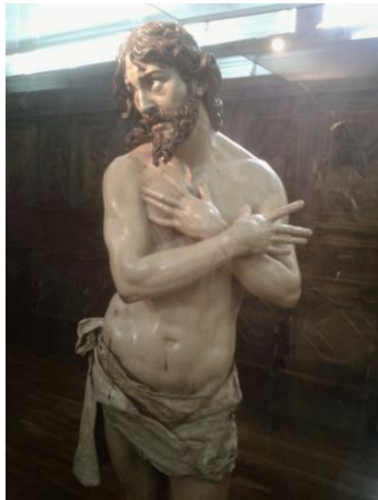
Ecce Homo (Gregorio Fernández)