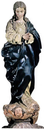
Inmaculada Catedral de Granada (Alonso Cano)