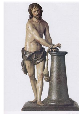
Cristo Flagelado (Gregorio Fernández)