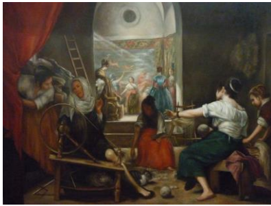
Las hilanderas (Velázquez)