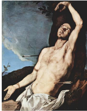
San Sebastián (José de Ribera)