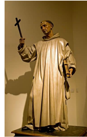
Santo Domingo (Martínez Montañés)