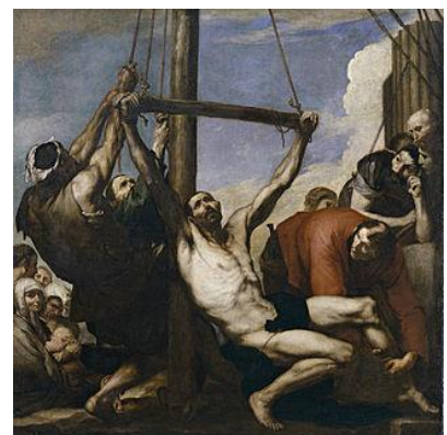
El martirio de San Felipe (José Ribera)