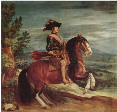
Felipe IV (Velázquez)