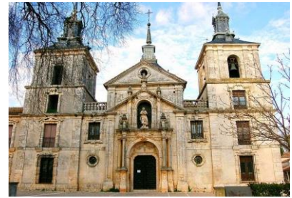
Palacio-iglesia de Nuevo Baztán (José de Churriguera)