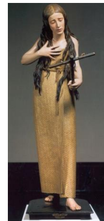
La Magdalena (Pedro de Mena)