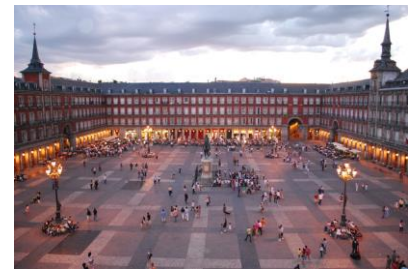
Plaza mayor de Madrid (Juan Gómez de Mora)