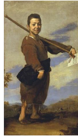
El Patizambo (José Ribera)