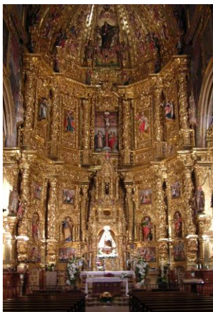
Retablo de la Iglesia parroquial (Navarrete)