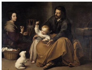
Sagrada familia del pajarillo (Murillo)