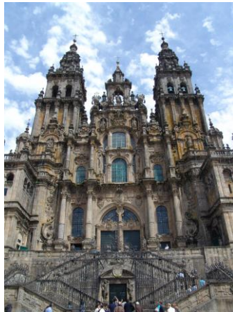
Fachada de catedral de Santiago del obradoiro (Fernando de Casas Novoa)