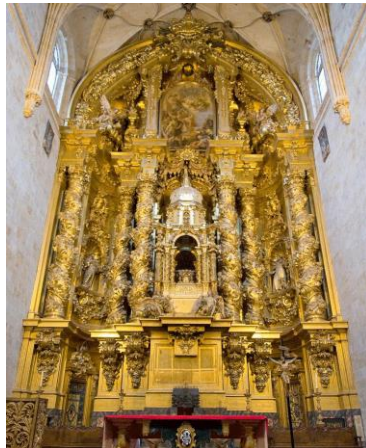
Retablo del Convento de San Esteban de Salamanca (José de Churriguera)