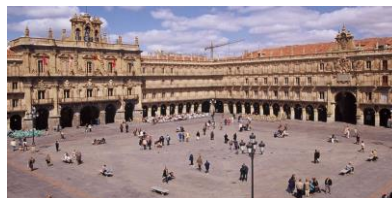
Plaza mayor Salamanca (Alberto Churriguera)